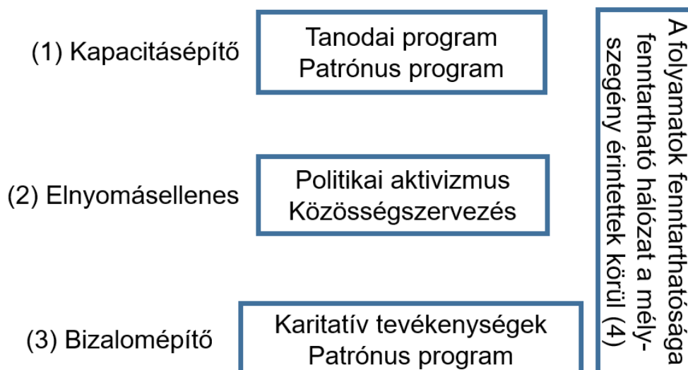
2. ábra A RAK-folyamat tevékenységei és szerepük a képessé tételben és átalakulásban (saját szerkesztés)

A megfelelő megélhetést biztosító munkahelyhez való hozzájutás példáján keresztül mutatjuk be az előzőekben felsorolt szempontok érvényességét. A munkahelyhez jutáshoz egyrészt szükség van (1) kapacitásépítésre – azaz arra, hogy a munkakeresők az ehhez szükséges készségekkel rendelkezzenek. Ezt szolgálhatja a tanodai program a gyermekek esetében (iskolai hátrányok kiegyenlítése) és a Patrónus program is (felnőttek esetében például együttműködés ön-életrajzírásban, e-mail-használatban, munkakeresésben stb.). A romák elhelyezkedési lehetőségeit azonban az előítéletek alapvetően korlátozzák. De ugyanígy befolyásolja ezt a helyi közintézmények azon magatartása, hogy azok jellemzően nem, vagy igen kis mértékben alkalmaznak roma, különösen mélyszegény munkavállalókat – a közmunkaprogramok kivételével. E tényezők befolyásolásának eszközei lehetnek az (2) elnyomásellenes tevékenységek, például a politikai aktivizmus és a közösségszervezés.