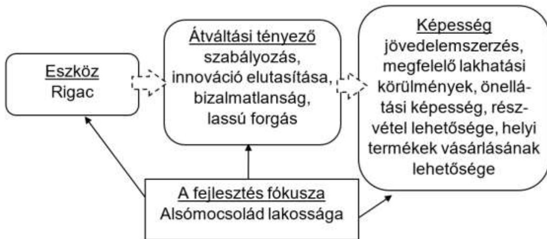
2. ábra A Rigac a képességszemléletre alapozott helyi gazdaságfejlesztés modelljébe ágyazva (Gébert et al., 2016 alapján saját szerk.)

A Rigac bevezetésének folyamata és működése a képességszemléletre alapozott helyi gazdaságfejlesztés modelljébe illesztve a 2. ábrának megfelelően ábrázolható.